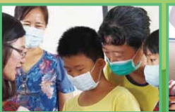
校長贈送壽星蛋糕