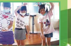
慶生、科學、慶祝新百